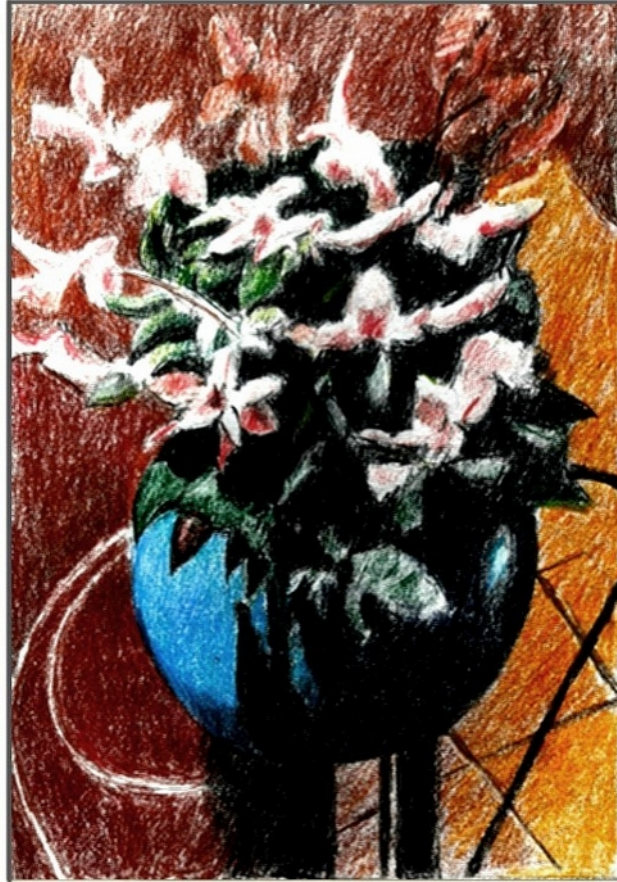
Blaue Vase 3

Friedrich Haugg Farbstifte auf Papier 20 x 28 cm