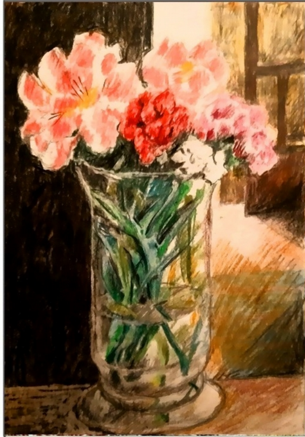
Glasvase 20 x 28 cm

Friedrich Haugg Farbstifte auf Papier 20 x 28 cm