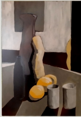
Stilleben mit Zitronen und Flaschen