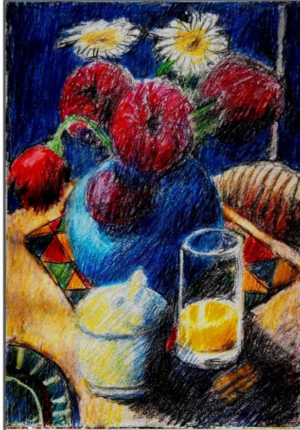
Blaue Vase 1 1. Teil

Friedrich Haugg Farbstifte auf Papier 20 x 28 cm