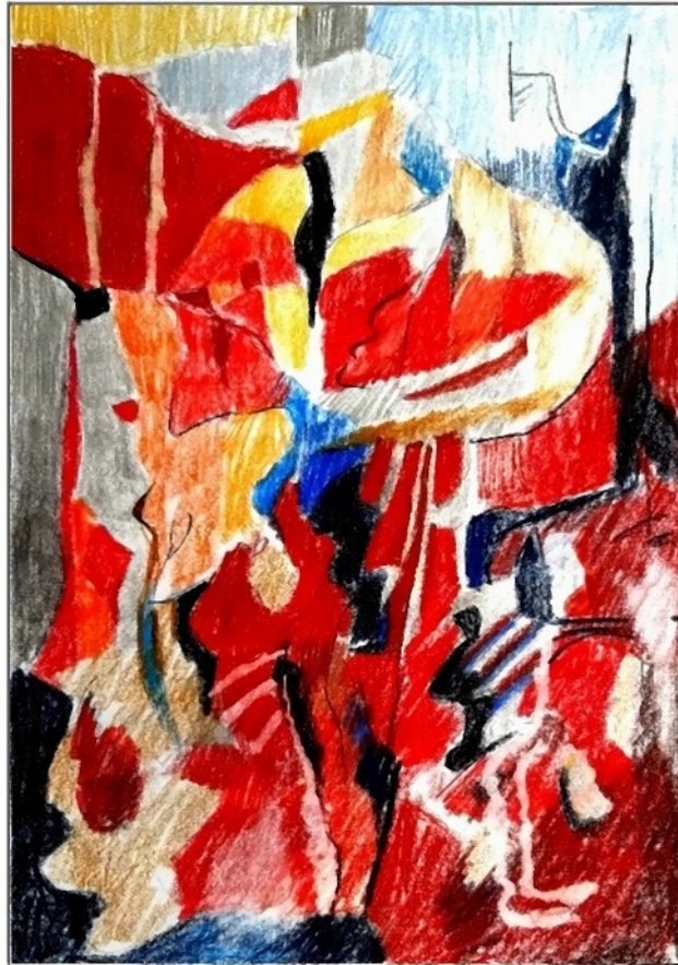
Komposition rot 1

Friedrich Haugg Farbstifte auf Papier 20 x 28 cm