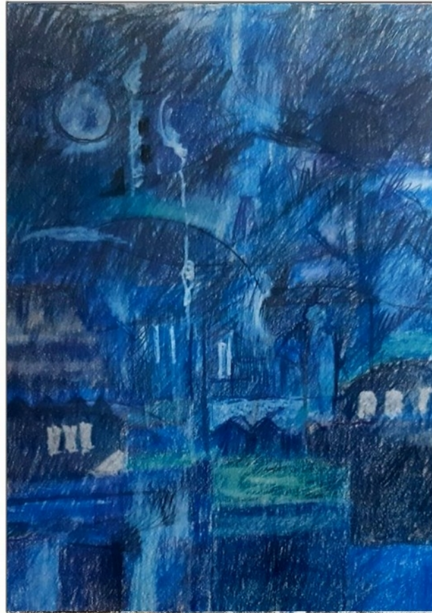
Komposition blau 2

Friedrich Haugg Farbstifte auf Papier 20 x 28 cm