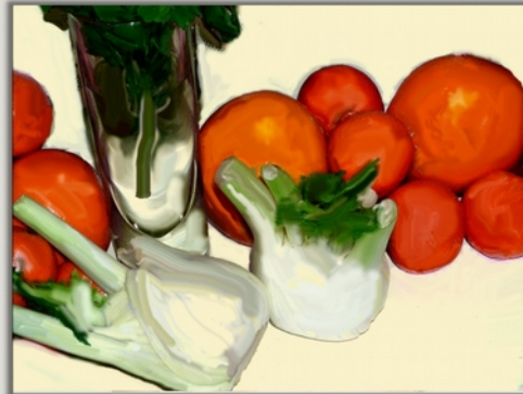
Stillleben mit Fenchel

● Friedrich Haug Öl auf Leinwand 50 x 70 cm