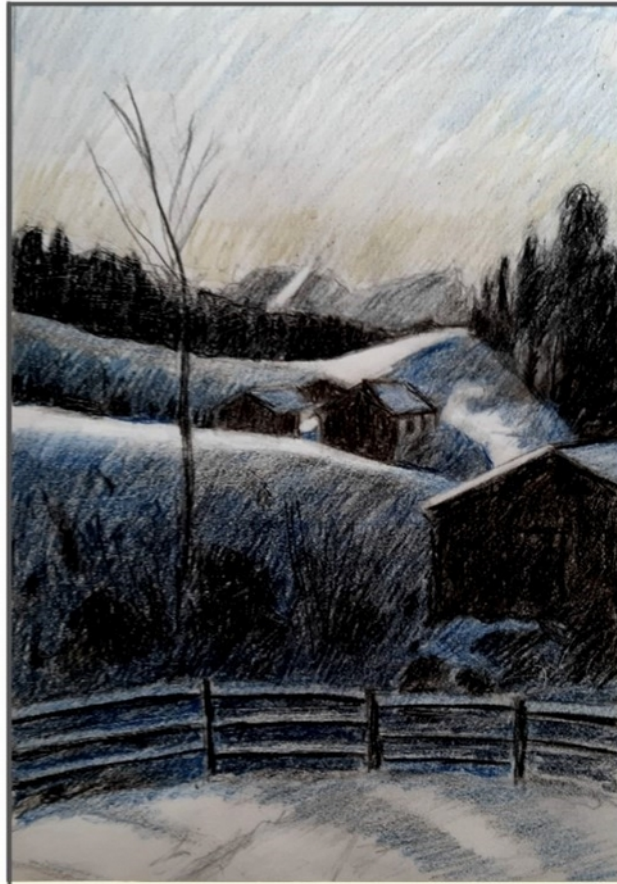
Auf der Wambergalm