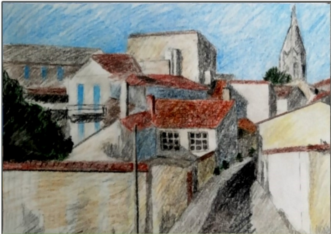
Le chateau d'Oleron

Friedrich Haugg Farbstifte auf Papier 20 x 28 cm