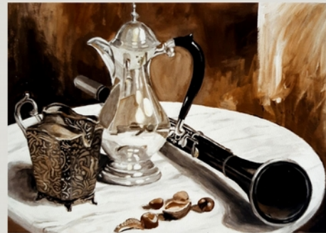
Stilleben mit Klarinette

Friedrich Haugg Wachskreiden auf Papier 20 x 28 cm