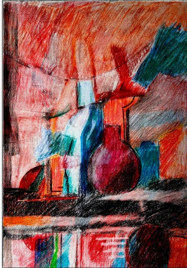
Rote und blaue Vasen

Friedrich Haugg Farbstifte auf Papier 20 x 28 cm