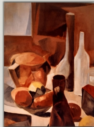
Stillleben mit Gefäßen

● Friedrich Haug Öl auf Leinwand 70 x 90 cm