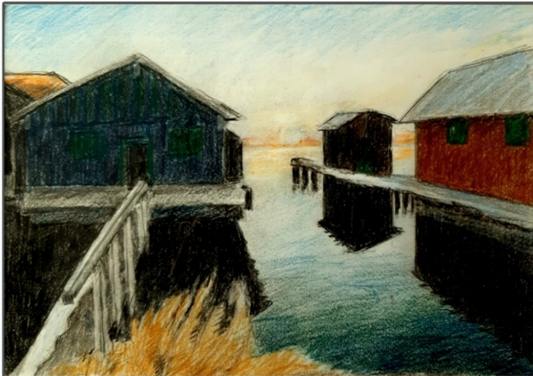
Bootshütten am Starnberger See

Friedrich Haugg Farbstifte auf Papier 20 x 28 cm