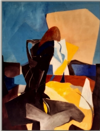
Frau im Cafe2

Friedrich Haugg • Öl auf Pappe 50 x 70 cm