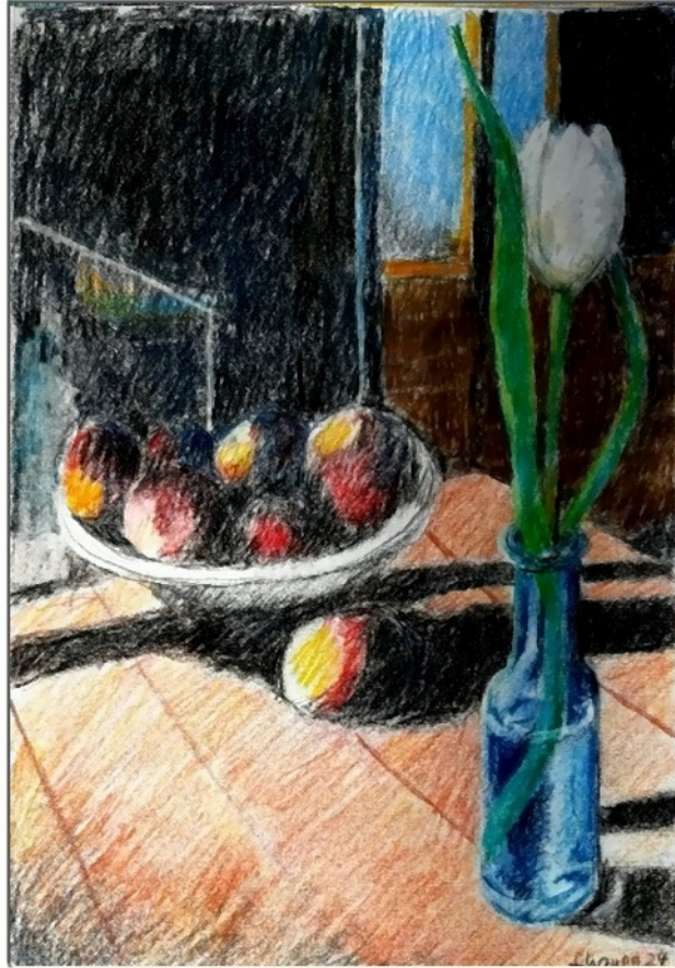
Äpfel mit Tulpe

Friedrich Haugg Farbstifte auf Papier 20 x 28 cm