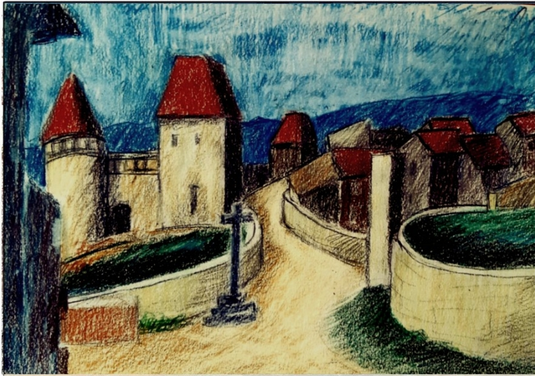
Chateau de la Cueilie

Friedrich Haugg Farbstifte auf Papier 20 x 28 cm