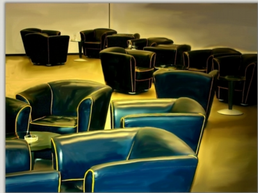
First class Schwechat

Friedrich Haugg • Öl auf Leinwand 70 x 90 cm