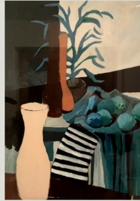
Stilleben mit gelber Flasche